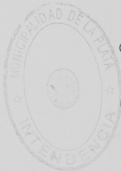
Dr. JULIO CESAR ALAK INTENDENTE MUNICIPALIDAD DE LA PLATA