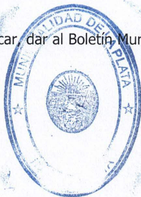
Dr. JULIO ALAK Intendente Municipalidad de La Plata